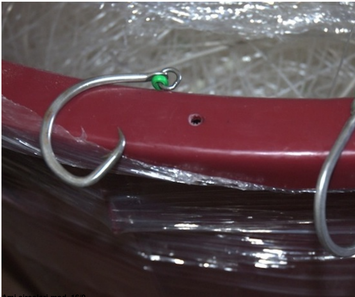
Ami circolari mod. 16/0.